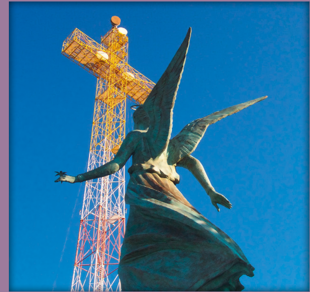
Antenne und Engel, Radio Vatikan