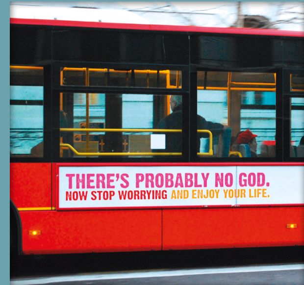
Atheismuswerbung in England 2009