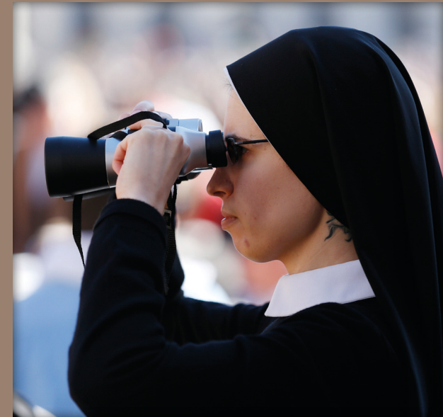
Ordensfrau bei einer Generalaudienz mit Papst Franziskus 2016